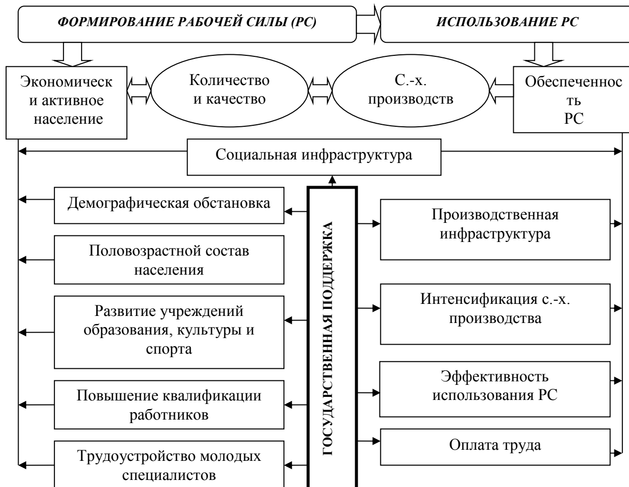
Рисунок 3.3.3 – Экономический механизм формирования и использования рабочей силы в сельской местности

На основе проведенных исследований разработан экономический механизм формирования и использования рабочей силы на селе (рис. 3.3.3).