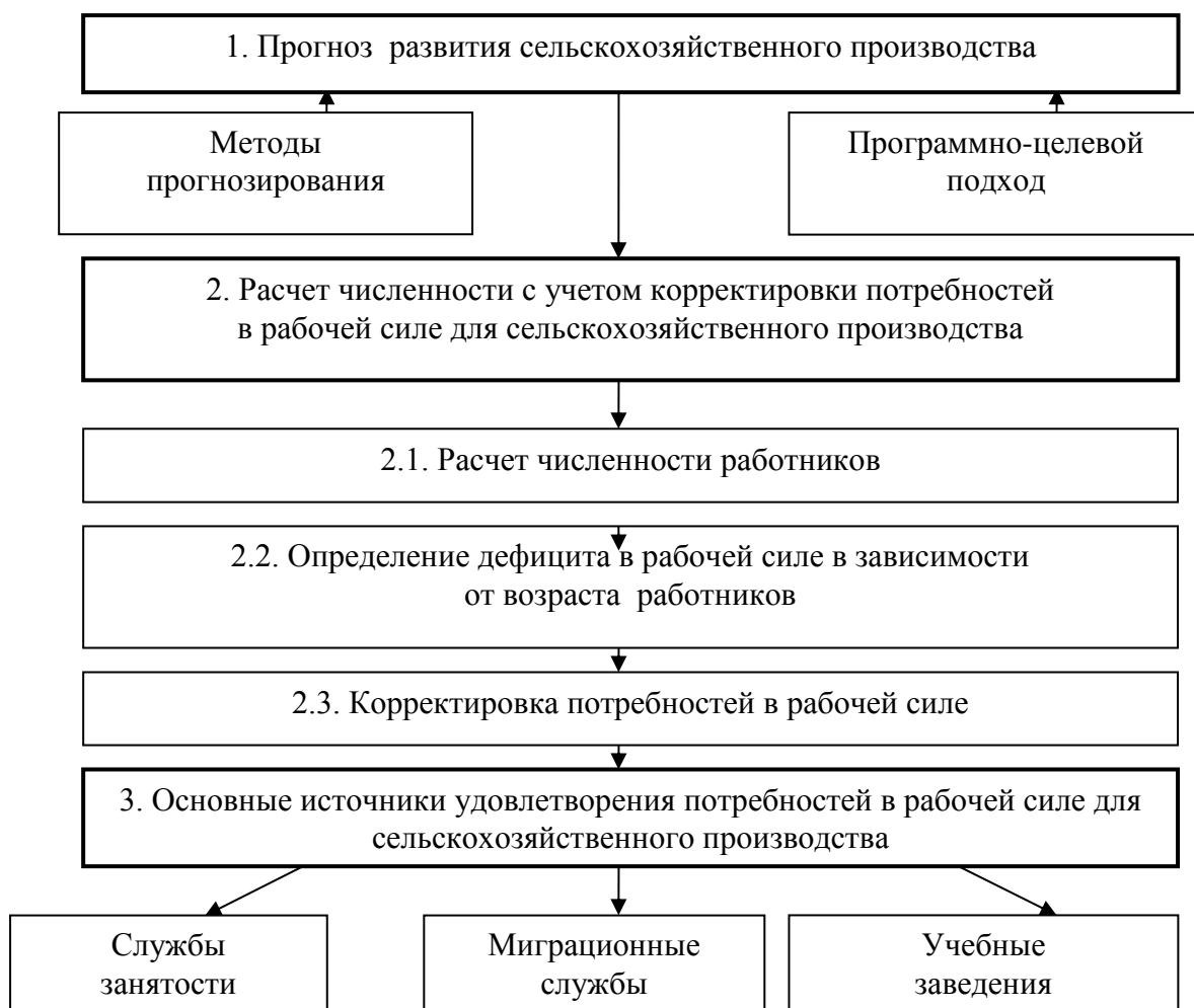
Рисунок 3.3.1 – Методика определения потребностей в рабочей силе для сельскохозяйственного производства

На первом этапе разрабатывается прогноз развития производства на основе анализа среднегодового поголовья коров и нормы обслуживания для операторов машинного доения с 2000 по 2007 год (табл.3.3.1).