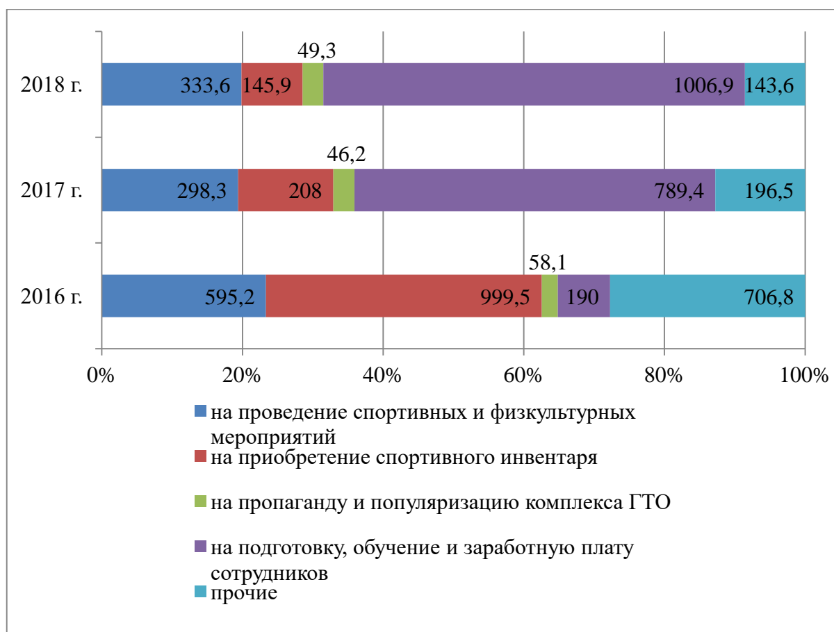
Рисунок 1 – Финансирование спортивных мероприятий ВФСК ГТО в 2016–2018 гг., млн. руб. (составлено автором на основе данных Министерства спорта РФ [6])

Финансирование мероприятий ВФСК ГТО, несмотря на рост популярности Комплекса, в динамике сократилось, изменилась и его структура (рис. 1).