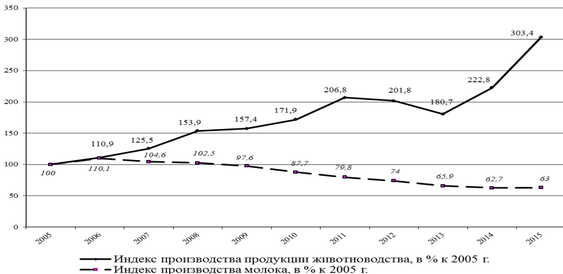
Рисунок 2 – Динамика базисных индексов производства продукции животноводства и молока в Тверской области [7, 8, 9]

Развитием молочного скотоводства в Тверской области занимается более 240 сельскохозяйственных организаций, а также крестьянские (фермерские) хозяйства и личные подсобные хозяйства. Крупными хозяйствами по производству молока в области являются: АО «Агрофирма «Дмитрова Гора» Конаковского района, ЗАО «Калининское» Калининского района, колхоз «Мир» Торжокского района, СПК «Новая жизнь» Бежецкого района, ООО «Искра» и ООО «Новая Заря» Старицкого района, колхоз «Победа» Лесного района, СПК колхоз «Красный Октябрь» Сонковского района [1].