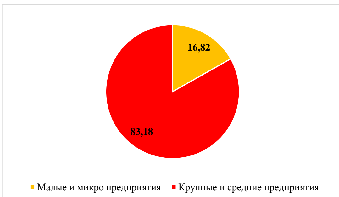
Рисунок 3 – Доля занятых в сфере малого и микро предпринимательства в общем числе занятых в Республике Марий Эл в 2015 г.

За анализируемый период 2011–2015 гг. развитие субъектов малого и микро бизнеса, несмотря на активную помощь данным субъектам со стороны государства в Республики Марий Эл, осуществлялось медленными темпами. В 2015 г. число малых предприятий увеличилось по сравнению с 2011 г. на 41 ед., или на 12,54 % (табл. 1). На низкую динамику развития малого бизнеса на территории Республики в данном периоде негативное влияние оказал финансово-экономический кризис.