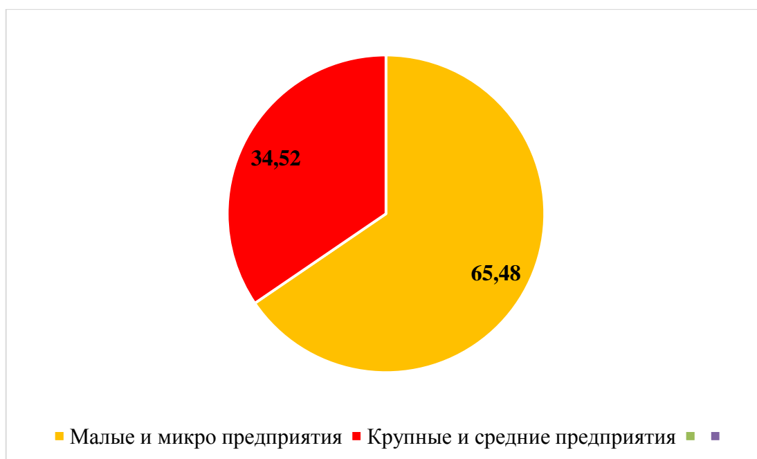
Рисунок 1 – Доля малых и микро предприятий в общем количестве зарегистрированных предприятий и организаций в Республике Марий Эл в 2015 г.

В 2015 г. в Республике Марий Эл действовало 15812 малых и микро предприятий, что составило около 34,52 % всех предприятий региона (рис.1) [6, 7].