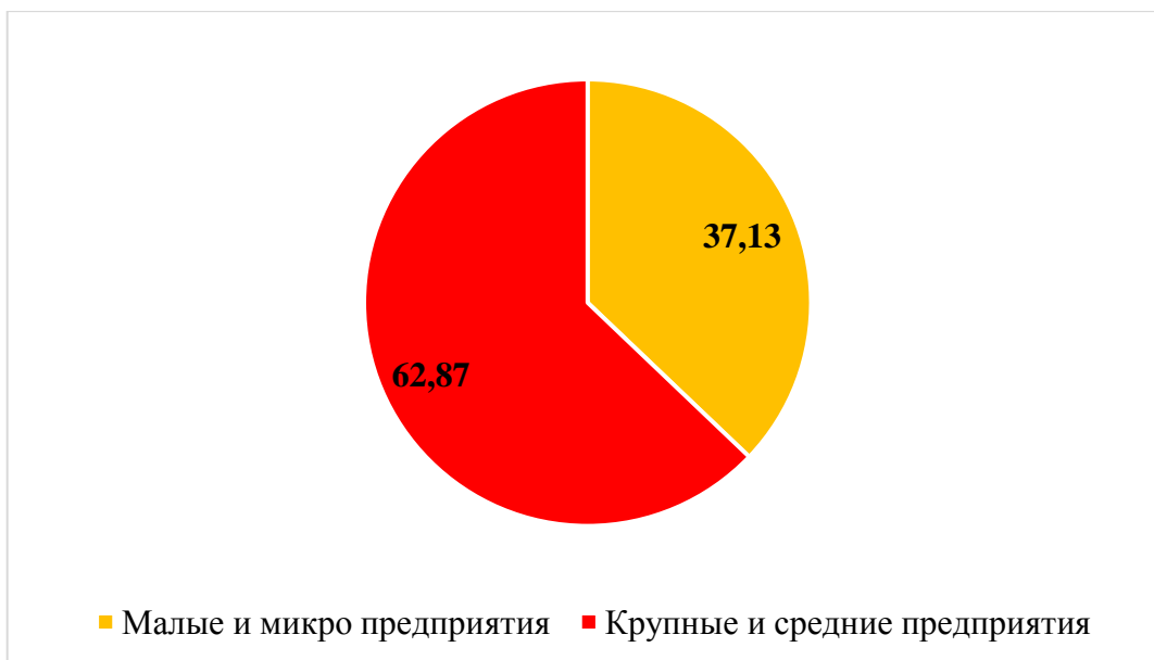
Рисунок 2 – Доля оборота малых и микро предприятий в общей величине оборота в Республике Марий Эл в 2015 г.