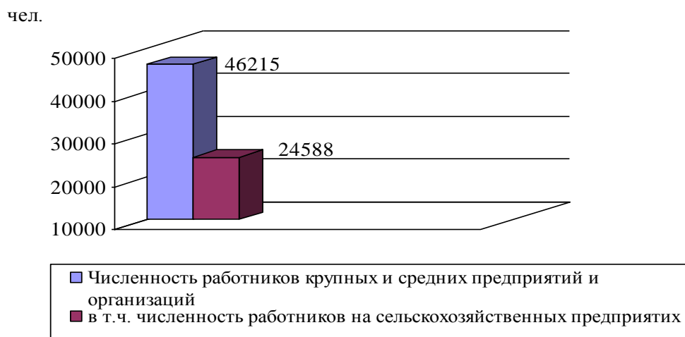
Рисунок 2.3.1 – Среднегодовая численность работников крупных и средних предприятий и организаций, расположенных в сельской местности Тверской области, 2007 г.

В сельской местности Тверской области основная доля работников задействована в сельскохозяйственных организациях (рис.2.3.1).