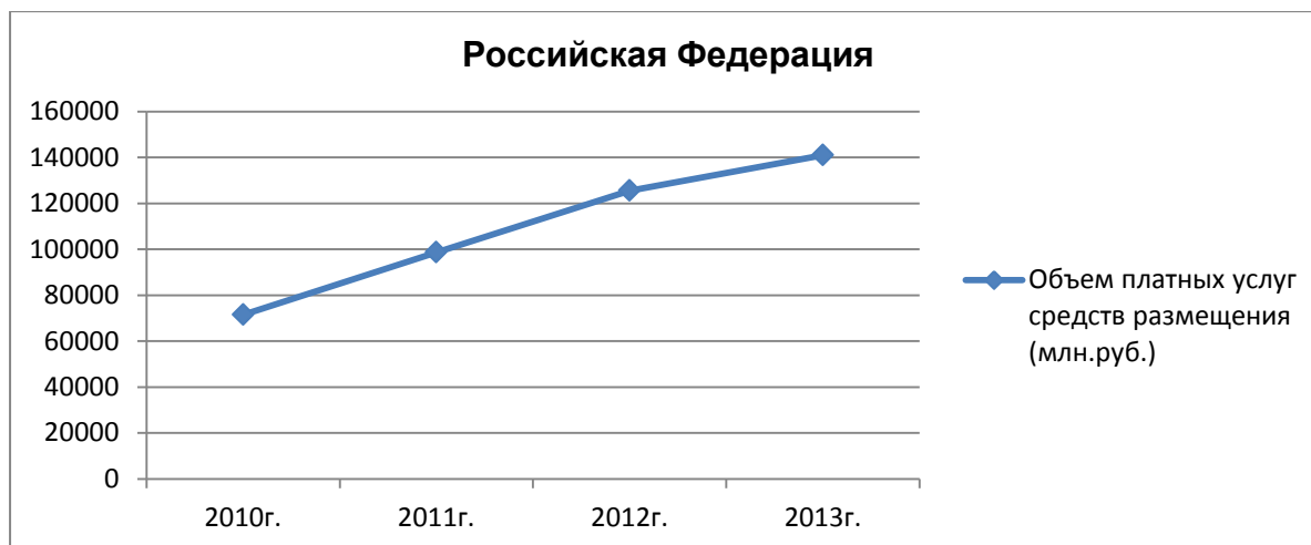
Рисунок 1 – Динамика оказания платных услуг размещения туристов в Российской Федерации за 2010-2013гг.

Экономическая эффективность туризма означает получение прибыли от организации туристской деятельности в масштабах государства. Внутренний туризм это хозяйственная деятельность предприятий туристского бизнеса, которые предоставляют туристские услуги только внутренним туристам. Он привязан к регионам [1]. Развитие регионального туризма способствует: